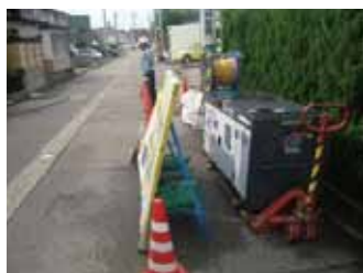
広い場所でコンプレッサーをハンドリフトに載せかえる