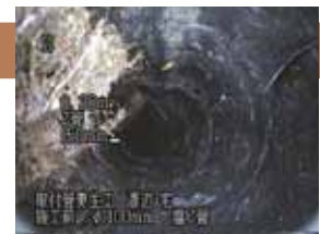
継ぎ目の木の根侵入