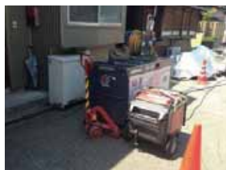
3Kva発電機は車輪つきを選択して、人力での移動が可能