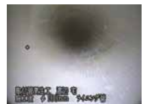
継ぎ目部分の木の根侵入箇所