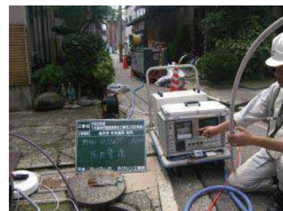
トラック等も進入出来ない狭小道路等での取付管ライニングの施工状況